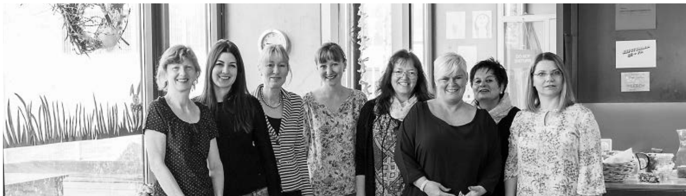
Engagiert, hilfsbereit und sympathisch - Die erfahrenen Betreuerinnen im Hort Laubegg

wert hat. Im Sommer sind sie viel draussen, dann leiten wir sie viel an. Dies geschieht insbesondere beim Rollschuhlaufen oder bei Bewegungsspielen zum Austoben.