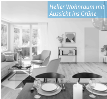
Heller Wohnraum mit Aussicht ins Grüne

Bei der Planung wurde viel Wert auf ein familienfreundliches Konzept gelegt. So werden Eigentumswohnungen von 2,5 bis 4,5 Zimmern angeboten. Dafür spricht der nahe Spielplatz umringt von