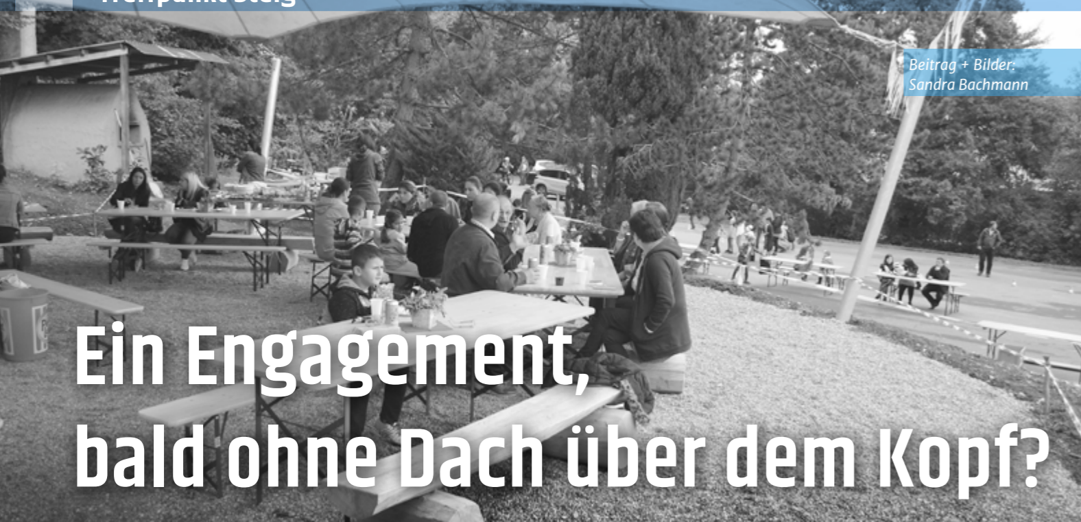
Beitrag + Bilder: Sandra Bachmann