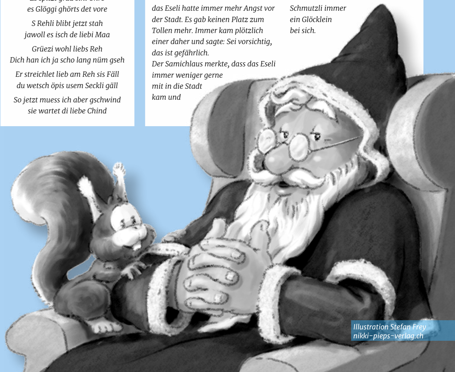
Illustration Stefan Frey nikki-pieps-verlag.ch

Das nächste Mal gingen Samichlaus und Schmutzli alleine in die Stadt. Aber, wo sie auch hin kamen sagten die Leute: Ja Samichlaus, bist du schon da, wir haben das Glöcklein gar nicht gehört. Er merkte, dass das Glöcklein, das sein Eseli immer hatte, für die Leute zum Zeichen geworden war, dass jetzt de Samichlaus kommt. Im nächsten Jahr nahm der Schmutzli das Glöcklein mit und unter lustigem Gebimmel gingen beide in die Stadt. Die Leute freuten sich, denn nun war wieder klar: Das lustige Gebimmel sagte allen: Der Samichlaus kommt! Seither haben Samichlaus und Schmutzli immer ein Glöcklein bei sich.