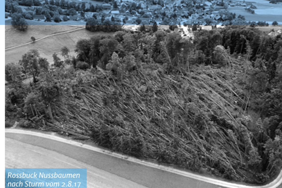
Rossbuck Nussbaumen nach Sturm vom 2.8.17